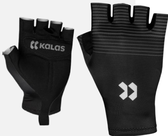
UNI n70532-UP01 (normaal) n70531-UP17 (aerodynamisch)