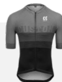
SHIRTS KORTE MOUW 10-12