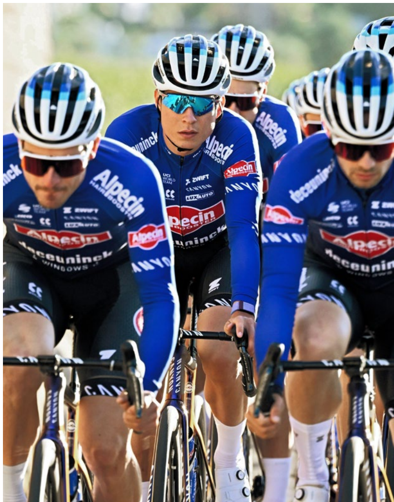
SHIRTS LANGE MOUW

Wanneer de temperatuur daalt, kan een shirt met lange mouwen het ideale alternatief zijn om ervoor te zorgen dat je tijdens je ritten een comfortabele temperatuur behoudt. Deze nauwsluitende truien uit onze PRO- en ELITE-collecties zijn gemaakt van isolerende en elastische stoffen met geborstelde vezels aan de binnenkant voor extra warmte en comfort. In het OFFROAD-gedeelte vind je opties voor BMX, MTB en gravel.