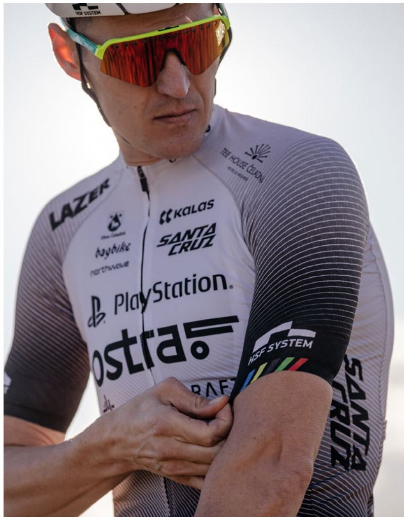
SHIRTS KORTE MOUW

Ons meest verkochte item is het shirt met korte mouwen. Kies uit de verschillende opties in patronen en stoffen in elk van onze collecties. Zo vind je zeker de perfecte trui voor jouw doel.