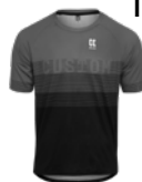
SHIRTS KORTE MOUW 13-14